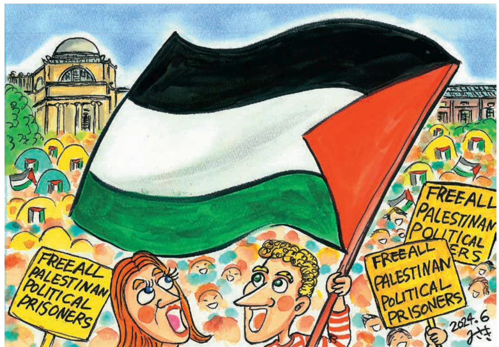
停戦を叫ぶ学生たち