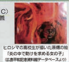
ヒロシマの高校生が描いた原爆の絵「炎の中で助けを求めた女の子」

ヒロシマの高校生が描いた原爆の絵 平和憲法を持つ意義 パネル「原爆と人間」 沖縄問題 各9条の会活動 尼崎の戦災地図 戦争に突き進んだ歴史年表 MADE IN JAPANの武器で子どもを殺さないで など