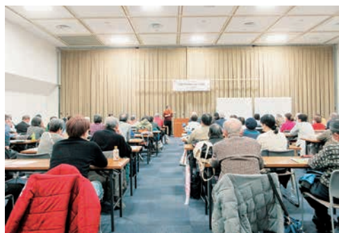
件は起きてしまいました。

日本の社会保障は、憲法25条に定められた生存権をもとにつくられた社会福祉(高齢者福祉、児童福祉、障害者福祉、公的扶助)があり、その下に社会保険(介護保険、労災保険、雇用保険、年金保険、医療保険)があります。社会保険は保険料を支払わないと給付が受けられません。貧困が原因で社会保険を外れた人には社会福祉を受け