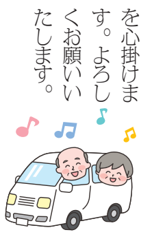
送迎運転手 朴 昇洙